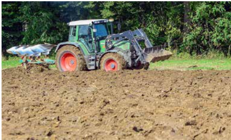
Auf Antrag können sich Landwirte Agrardiesel steuerlich begünstigen lassen.

Die entstehende Vergünstigung kann bei entsprechendem Verbrauch ein bedeutendes Ausmaß annehmen.